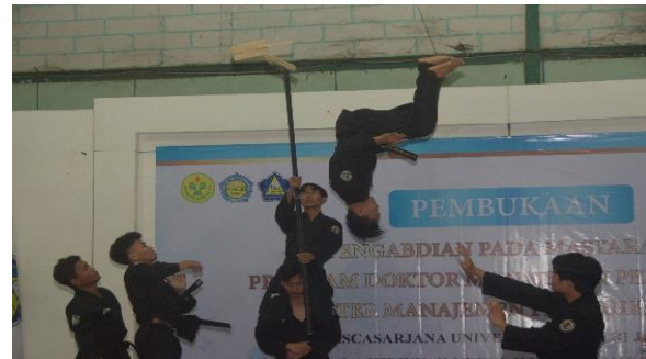
Gambar 3. Seni bela diri dari siswa Pondok Pesantren