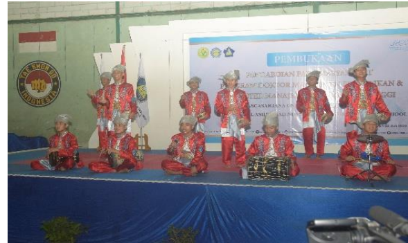
Gambar 2. Seni tari dari siswa Pondok Pesantren

bela diri yang mereka pelajari di pondok pesantren.