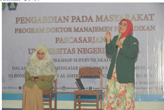
Gambar 8. Kegiatan Knowledge Sharing

Setelah dijelaskan secara detail bagaimana implementasi supervisi akademik di era merdeka belajar, kegiatan berikutnya yaitu knowledge sharing yang dilakukan oleh guru yang sedang menempuh jenjang doktoral manajemen pendidikan UNJ.