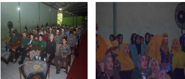
Gambar 1. Peserta workshop P2M

Workshop supervisi akademik bertujuan untuk mendorong perbaikan kualitas mengajar para guru di era Merdeka Belajar. Supervisi akademik menjadi elemen penting dalam mencapai tujuan tersebut, karena melalui proses ini, guru-guru dapat mendapatkan dukungan, bimbingan, dan umpan balik yang konstruktif untuk meningkatkan kemampuan mengajar mereka di pondok pesantren. Pada Gambar 1 di bawah ini menunjukkan antusiasme peserta yang terdiri dari guru dan dosen dalam kegiatan pengabdian pada masyarakat (P2M) ini.