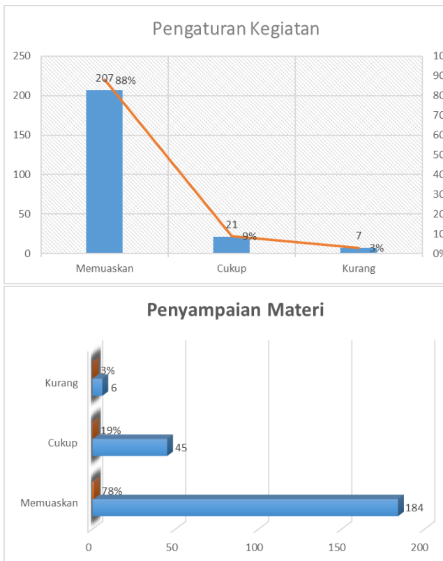
Gambar 9. Hasil Evaluasi Kegiatan

Dari gambar 9 di atas terlihat peserta begitu merasa puas selama kegiatan berlangsung. Dari 235 guru yang mengisi angket evaluasi, 69% ketepatan waktu, 88% untuk pengaturan kegiatan, dan 78% untuk penyampaian materi memuaskan bagi mereka. Dengan demikian, kegiatan pengabdian kepada masyarakat dikatakan baik.