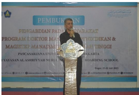
Gambar 5. Pimpinan Yayasan Al-Ashriyyah Nurul Iman

menyampaikan harapan pada kegiatan ini akan memberikan dampak positif dan berkesinambungan bagi pengembangan kualitas pendidikan di Pondok Pesantren, sehingga guru dapat lebih siap dan mampu menghadapi tantangan pendidikan yang semakin dinamis.